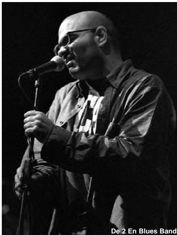
De 2 En Blues Band

todo ello con paseo de exhibición entre el animado público. Si la cosa hubiera terminado ahí estaríamos hablando ahora de un concierto corto, pero intenso, en el que a pesar de que casi todo fueron versiones, éstas estuvieron bien elegidas y sin caer en la verbena. Pero el bis se convirtió en larga sesión en la que de vuelta al órgano, Peterson se empeñó en ofrecernos una extensa tanda de sus composiciones propias que, salvo a los incondicionales del Hammond, aburrieron notablemente al respetable, sobre todo después del fiestorro guitarrero anterior. El sábado telonearon los De Dos en Blues Band . El numeroso combo, que incluía además de lo normal a una molona sección de vientos, estuvo a la altura de la ocasión y mantuvo entretenido al personal sin vulgarizar en exceso ni dar la chapa. Luego vimos a Dave Hole , monstruo australiano de la guitarra slide, tan ágil con los pies como con las manos, que encandiló al